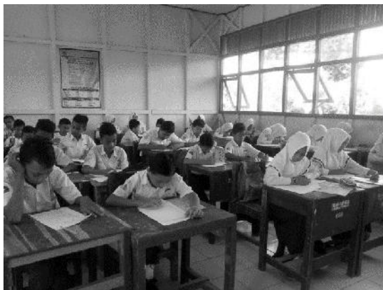
Gambar 1. Situasi Pelaksanaan Tes

Berbasis Masalah (PBM) terintegrasi dengan pendekatan saintifik. Untuk melihat hubungan antara hasil belajar dan tingkat berpikir siswa, pembelajaran dilaksanakan sebanyak 3 kali pertemuan. Pelaksanaan tes berjalan lancar dan tertib. Situasi pelaksanaan tes terlihat pada Gambar 1 berikut.