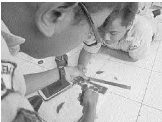
Gambar 1. Siswa mengukur diameter jeruk

Guna mengurangi dominasi guru dan menambah peran siswa dalam pembelajaran matematika, pendekatan-pendekatan pembelajaran matematika yang konstruktivistik merupakan pilihan yang pertama.