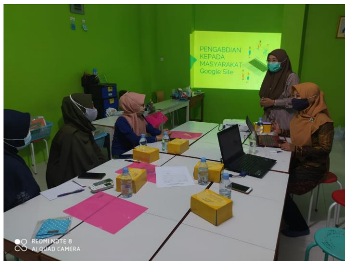
Gambar 1. Kegiatan pembukaan pendampingan

Sebelum Pelaksanaan, tim pengabdian melakukan sharing terlebih dahulu dengan pengelola terkait dengan pengelolaan Kumon dan Metode Pembelajaran yang dilaksanakan di Kumon Ngringo Palur. Hasilnya, tim pengelola Kumon Ngringo Palur belum familiar untuk menggunakan google site. Kegiatan yang dilaksanakan meliputi lima hal : (1) Pembukaan dan Pengenalan Tim, pembukaan ini dibuka langsung oleh pelaksana dibantu 1 orang mahasiswa. Pengelola Kumon Ngringo Palur juga turut hadir dan memberikan sambutan. (2) Penyampaian Materi tentang Optimalisasi Google Site. Dalam kegiatan ini pelaksana memberikan penjelasan dengan metode ceramah kepada peserta tentang apa itu Google site dan manfaat google site dalam dunia pendidikan dan usaha. Selanjutnya pelaksana juga menunjukkan contoh-contoh website dengan menggunakan google site. (3) Kegiatan tanya jawab dan demo google site. Selanjutnya pelaksana mendemokan google site dan bagaimana cara menggunakan google site kepada peserta. Pelaksana juga memberikan waktu Tanya jawab kepada peserta bagian mana yang kesulitan dalam penggunaan dan mengisi menu-menu. (4) Review hasil kegiatan, sharing informasi dan peserta diberikan waktu untuk mencoba mengisi menu-menu dengan menggunakan google site (5) Penutup dilanjutkan evaluasi dengan memberikan kuesioner. Hasil jawaban peserta 100% jelas dengan penjelasan pemateri namun harus ada tambahan waktu lagi.