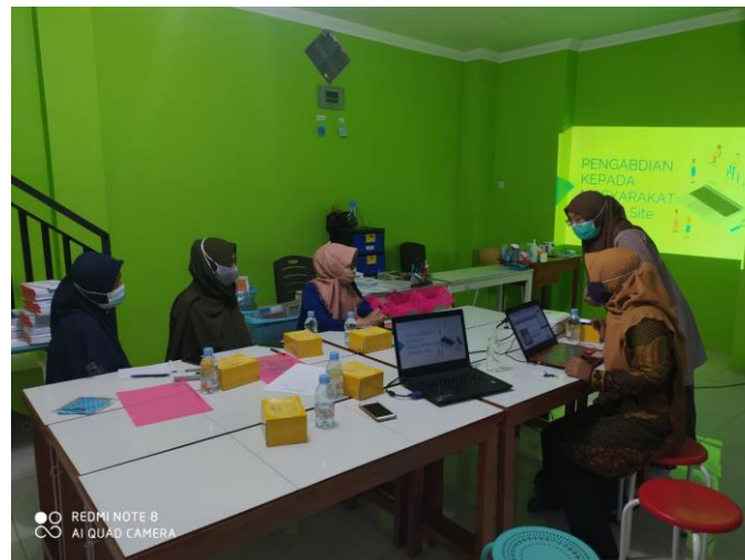
Gambar 2. Kegiatan Diskusi pendampingan

Luaran IPTEK yang dicapai adalah ilmu praktis tentang mengoperasikan Google Site, dan bagaimana meletakkan gambar-gambar produk di dalamnya untuk promosi dan konten pembelajaran. Untuk hasil website peserta belum bisa ditampilkan mengingat terbatasnya waktu ketika pendampingan sehingga tidak memungkinkan peserta membuat website satu-satu terlebih dahulu. Namun pada intinya peserta sudah mengetahui bagaimana cara mengisi konten-konten pembelajaran dalam website tersebut.